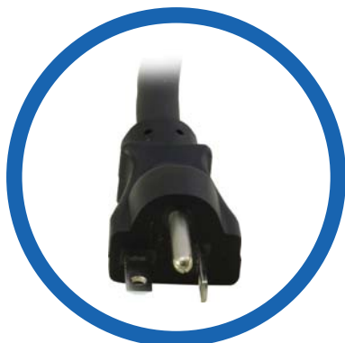
Cable de alimentación CA NEMA 5-20P