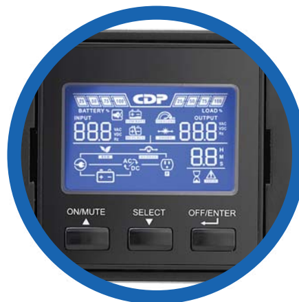
Panel LCD con rotación de 90°