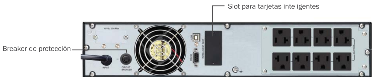
Vista trasera del equipo