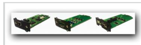
Tarjetas opcionales SNMP y de control