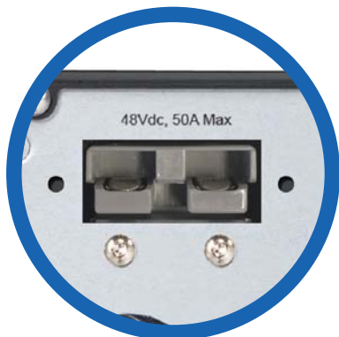
Conector para bancos de baterías externo