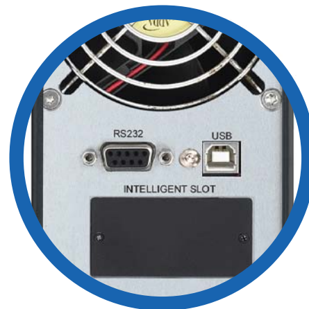
Puertos de comunicación