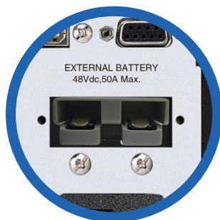
Conector para banco de baterías adicionales