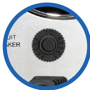
Breaker de protección