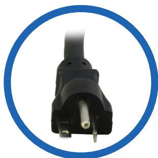
Cable de alimentación CA NEMA 5-20P