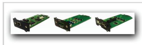
Tarjetas opcionales SNMP y de control