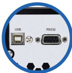
Puertos de comunicación